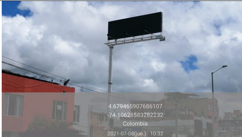
Foto 2. Vista del panel Sur-Norte y de la estructura de la valla en buenas condiciones y estable.